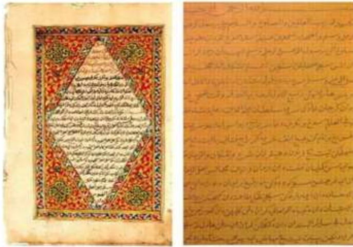
Hikayat Hang Tuah