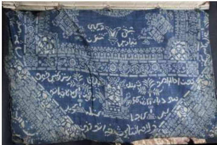
Kain batik dijadikan pembalut mss

http://britishlibrary.typepad.co.uk/asia-and-african/2014/06/two-letters-in-maguindanao.html#sthash.oGxTEz9A.dpuf